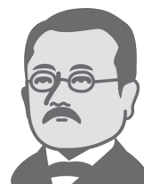
北里 柴三郎 (きたさと しばさぶろう) 1853-1931

「近代日本医学の父」と称される微生物学者。破傷風血清療法確立、ペスト菌の発見のほか、伝染病研究所、北里研究所を創立し後進の育成にも尽力しました。