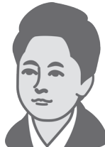
津田 梅子 (つだ うめこ) 1864-1929

近代的な女子高等教育に尽力した教育家。日本最初の女子留学生の一人であり、女子英学塾(現・津田塾大学)を創設しました。