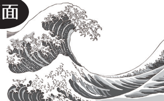
富嶽三十六景(神奈川沖浪裏)