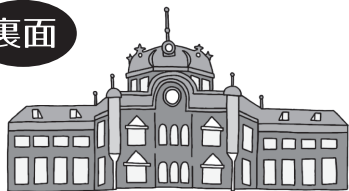
東京駅(丸の内駅舎)

「赤レンガ駅舎」として親しまれた歴史的建造物。国の重要文化財に指定されています。